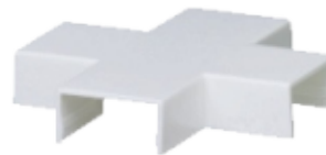
Cruzeta Cód. 512.200.7