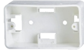
Caixa 4x2 Medida 104x61x42 Cód. 512.200.1