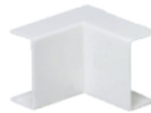
Cotovelo Interno Cód. 512.200.3