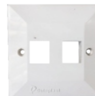
Espelho 3x3 2 RJ's Cód. 512.210.3