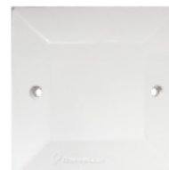
Espelho 3x3 Cego Cód. 512.210.1