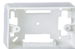
Caixa 4x2 Medida 113,9x71,8x41 Cód. 512.201.0

Os espelhos D300 da Linha Dutopop se encaixa perfeitamente na caixa 4x2.