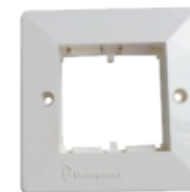
Espelho 3x3 2 Módulos Cód. 512.210.5