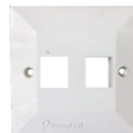
Espelho 3x3 2 RJ's Cód. 512.210.3