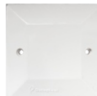
Espelho 3x3 Cego Cód. 512.210.1