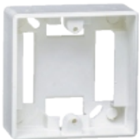
Caixa 3x3 Baixa Medida 75x75x31 Cód. 512.200.8