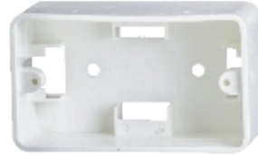
Caixa 4x2 Medida 104x61x42 Cód. 512.200.1