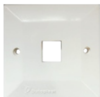
Espelho 3x3 1 RJ Cód. 512.210.2