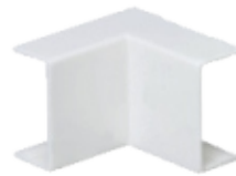
Cotovelo Interno Cód. 512.200.3