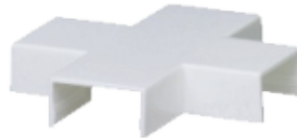
Cruzeta Cód. 512.200.7