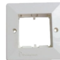
Espelho 3x3 2 Módulos Cód. 512.210.5