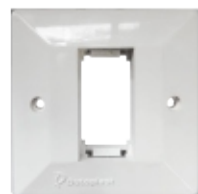
Espelho 3x3 1 Módulo Cód. 512.210.4