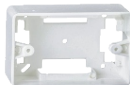
Caixa 4x2 Medida 113,9x71,8x41 Cód. 512.201.0

Os espelhos D300 da Linha Dutopop se encaixa perfeitamente na caixa 4x2.