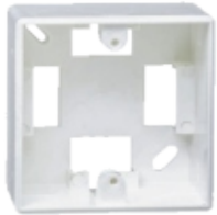
Caixa 3x3 Alta Medida 75x75x41 Cód. 512.200.0