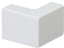
Cotovelo Externo Cód. 512.200.4