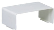
Luva Cód. 512.205.6