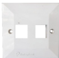
Espelho 3x3 2 RJ's Cód. 512.210.3