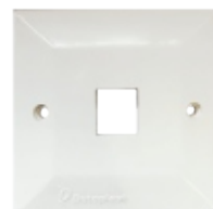
Espelho 3x3 1 RJ Cód. 512.210.2