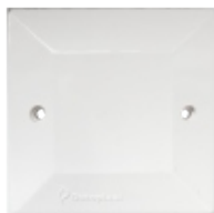
Espelho 3x3 Cego Cód. 512.210.1