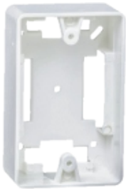
Caixa 4x2 Medida 113,9x71,8x41 Cód. 512.201.0