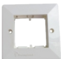
Espelho 3x3 2 Módulos Cód. 512.210.5