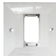
Espelho 3x3 1 Módulo Cód. 512.210.4