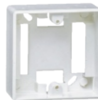
Caixa 3x3 Baixa Medida 75x75x31 Cód. 512.200.8