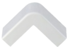
Cotovelo Externo Cód. 512.205.4